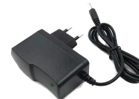
Fuente de alimentación